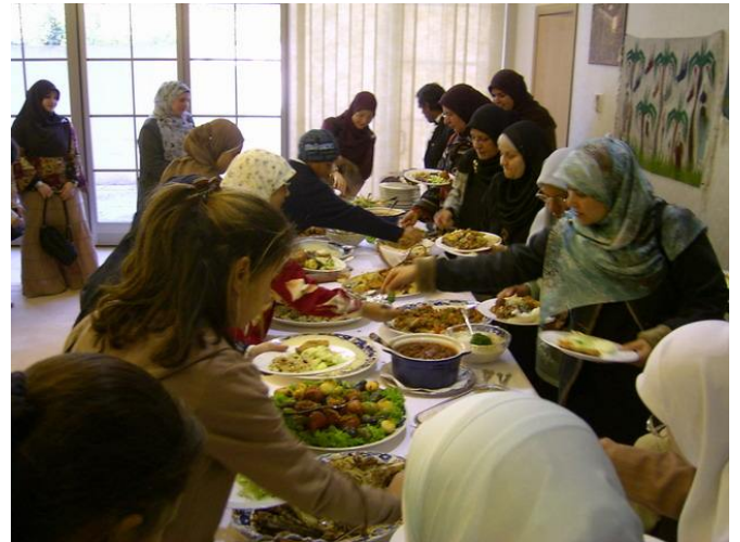
Around the food