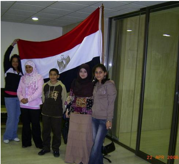
The Young members with the Egyptian flag