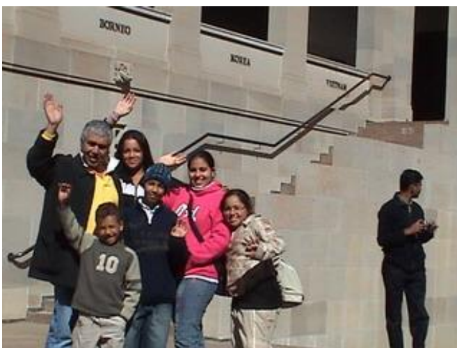
In front of the war memorial